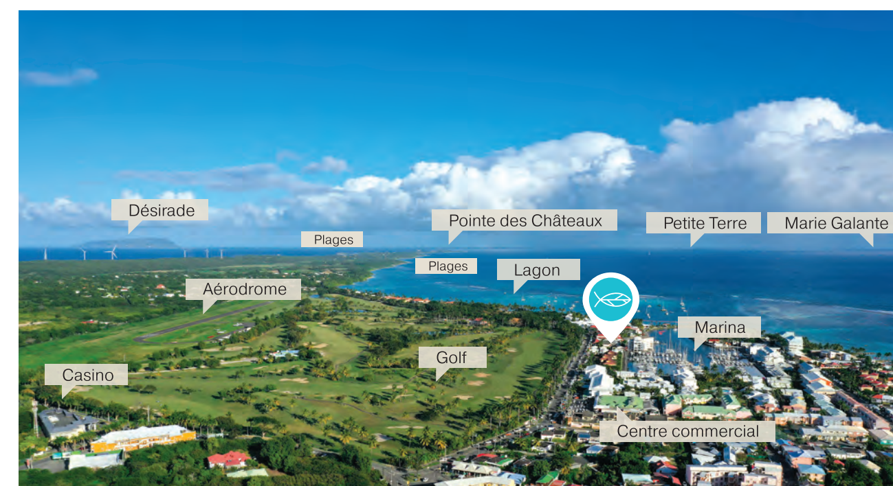
Vue aérienne de la Marina de Saint-François

Au cœur du port de plaisance de Saint François, les Terrasses de la Marina vous offrent un emplacement exceptionnel et un panorama unique sur un lagon bleu turquoise. Entre le port, les plages, les espaces naturels et l'ambiance authentique d'un village créole, la résidence propose une vraie vie de quartier avec ses nombreux commerces et son marché.