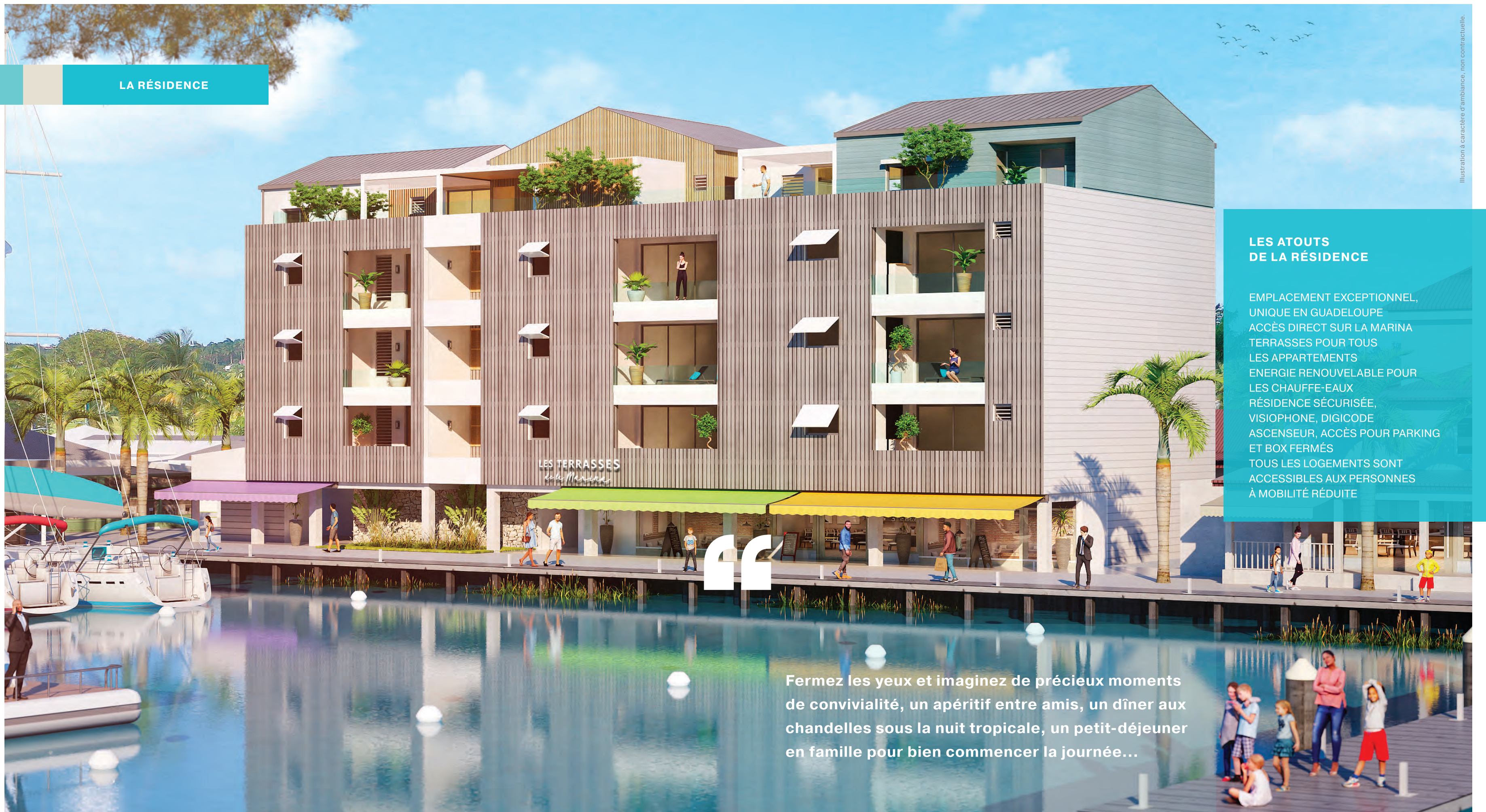
Illustration à caractère d'ambiance, non contractuelle.